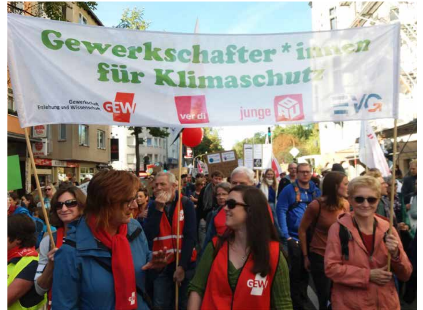
Klimaschutz und gute Arbeit gehören zusammen. GEW-Köln bei der Klima-Demo am 20. September 19.

Weltweit sind am 20. September über sieben Millionen Menschen auf die Straße gegangen. globalclimatestrike.net berichtet von 6.100 Protesten und Demonstrationen in 185 Ländern. Die größten davon in Montreal mit 500.000 Teilnehmer*innen und in New York mit 300.000. In Italien und Deutschland waren jeweils 1,5 Millionen auf der Straße. 270.000 davon waren es allein in Berlin.