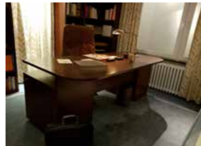
Fotos: Helga Pennartz (S. 32 Originalporträtfoto: Herlinde Koelbl)