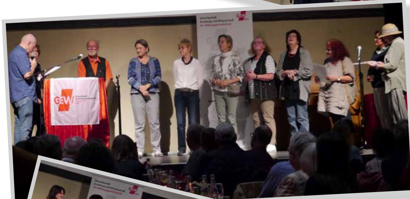
Den anwesenden 40jährigen Jubilar*innen wird die Ehrenurkunde und -nadel überreicht.