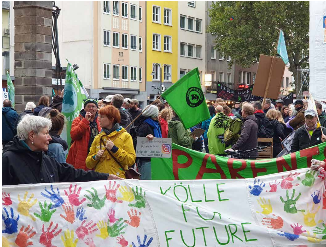
Am 4. Oktober 2019 kam es zur ersten Freitagabend-Demo von „parents for future“ und anderen mit rund 250 Teilnehmer*innen an einem ungemütlichen Tag.